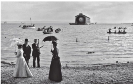
Motiv im Oktober: Der König und die Königin von Württemberg (links) in Manzell anlässlich des zweiten Aufstiegs am 17. Oktober 1900.