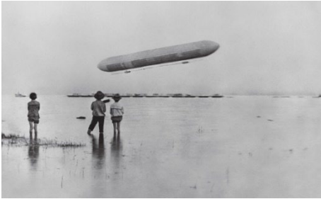
Titelbild: Kinder beobachten den ersten Aufstieg eines Zeppelin-Luftschiffs in Manzell am Bodensee am 2. Juli 1900.