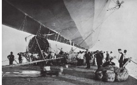
Motiv im März: LZ 1 kurz vor dem Start zur ersten Fahrt. Kielansicht des LZ 1 über dem Ponton mit Haltemannschaft. Im Hintergrund die schwimmende Luftschiffhalle.