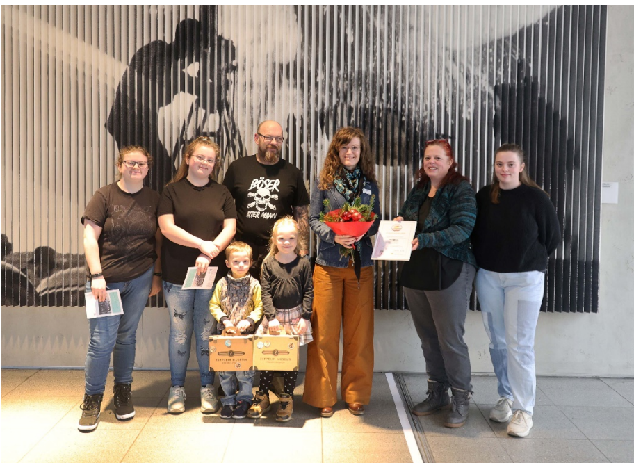
Auszeichnung Fair Family Gütesiegel 2024

Pressebilder entnehmen Sie bitte unter Angabe der entsprechenden Credits dem folgenden Link: Auszeichnung mit dem Fair Family Gütesiegel